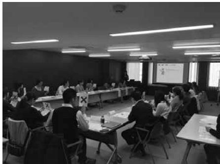
復職支援活動(研修会)