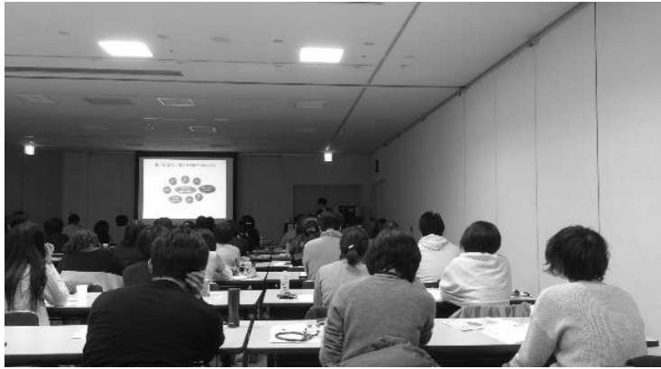
第2回埼玉県三士会合同訪問リハビリテーション実務者研修会（Advance コース）