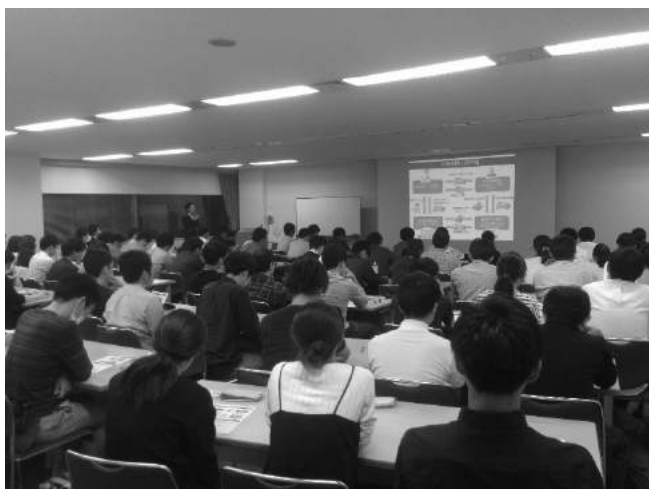
医療制度改革に関する研修会