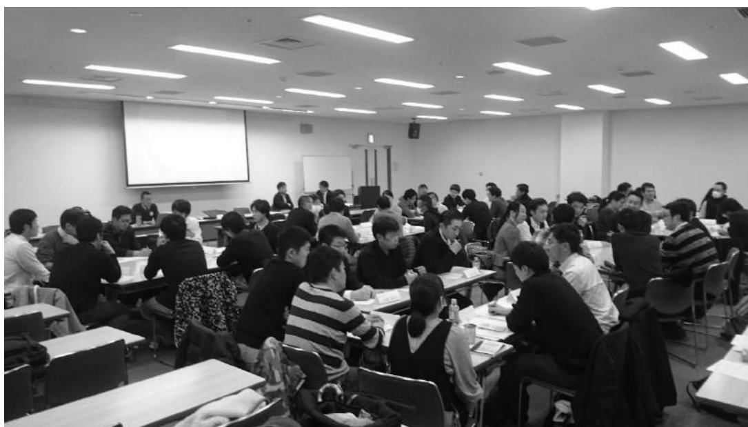
代表者会議 開催風景