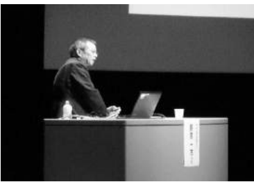
テクニカルセミナー