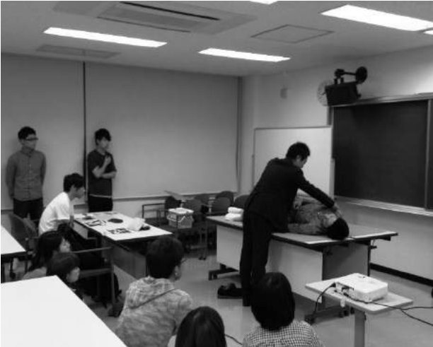
東松山エリア研修会の様子