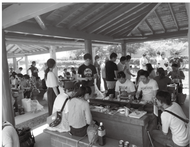
北部ブロック新人歓迎BBQ