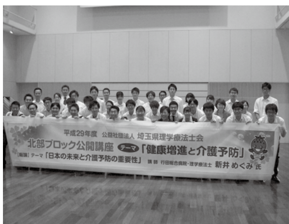
公開講座終了後の1枚