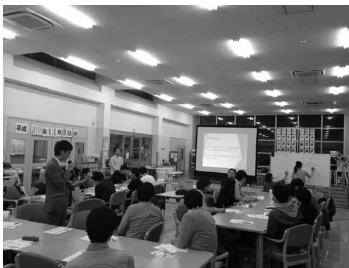
東松山市市町村会議の様子