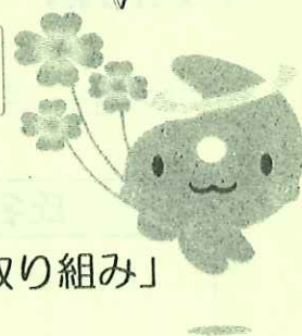
埼玉県社協マスコット「シャキたまくん」