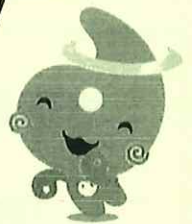
埼玉県社協マスコット 「シャキたまくん」

高知県出身。介護福祉士。1987年国鉄職員から福祉の業界へ転身し、特別養護老人ホームなどで勤務。東京都で初めてのグループホームの施設長となり、その実践がテレビなどで紹介される。現在は大起エンゼルヘルプ取締役のほか、「注文をまちがえる料理店」理事長をはじめ、各種メディア、研修・講演会等で認知症・介護関連のメッセージを発信している。