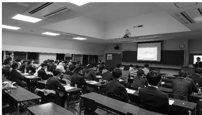
症例検討会（川越エリア）