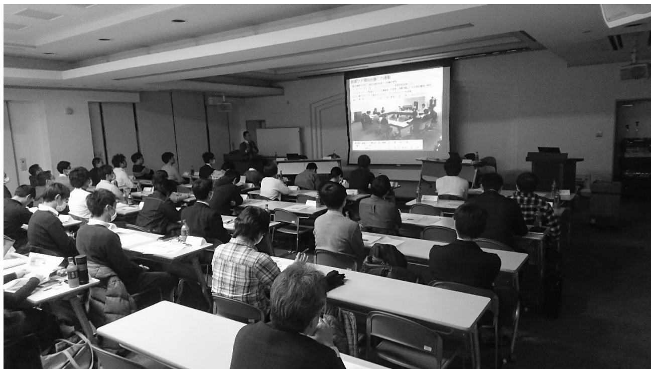
代表者会議 開催風景