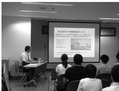
坂戸エリア研修会