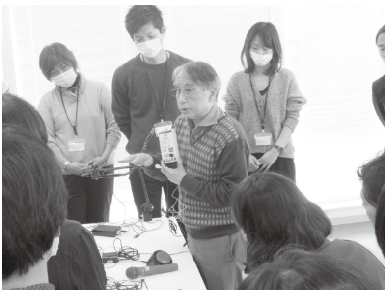
第5回 埼玉県リハビリ三団体主催会 訪問リハビリテーション実務者研修会（BADVANCE）コース