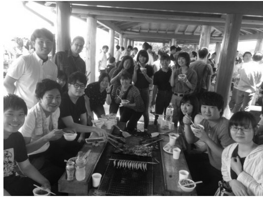
北部ブロック新人歓迎BBQ