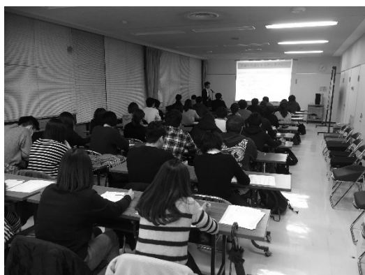
第3回研修会（所沢エリア）