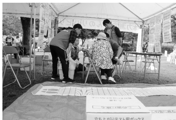
リレーフォーライフジャパン川越における活動風景