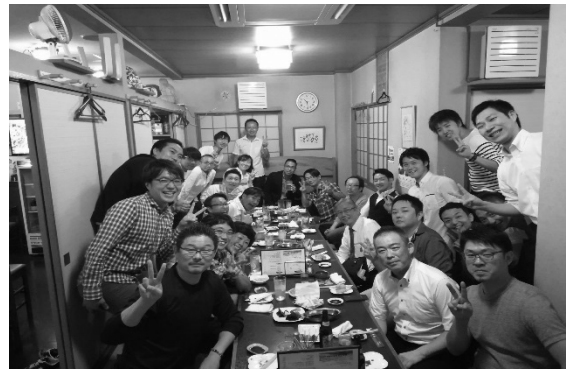
東松山エリア交流会