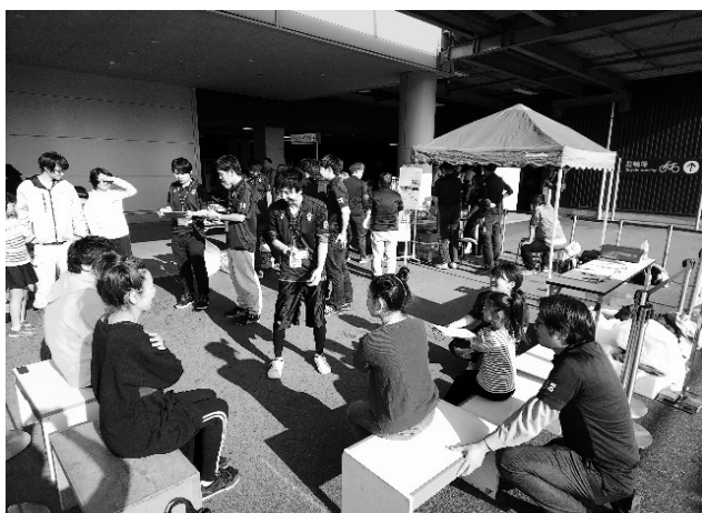
啓発活動事業風景