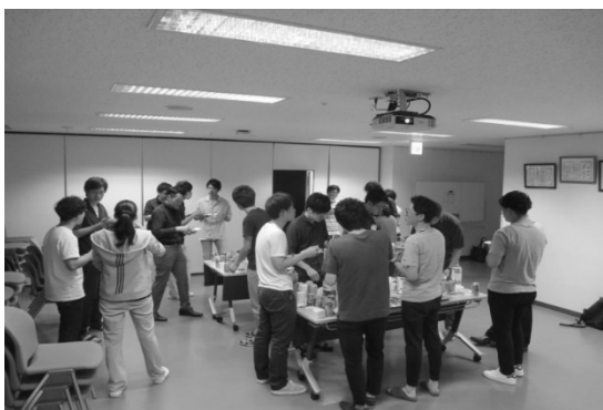
坂戸エリア交流会