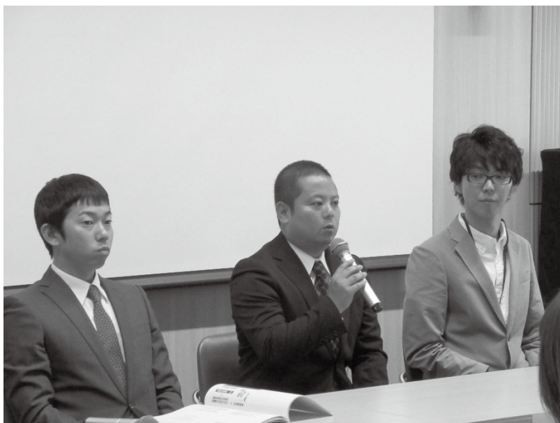
第9回 埼玉県リハビリ三団体主催会 訪問リハビリテーション実務者研修会（BASIC）コース