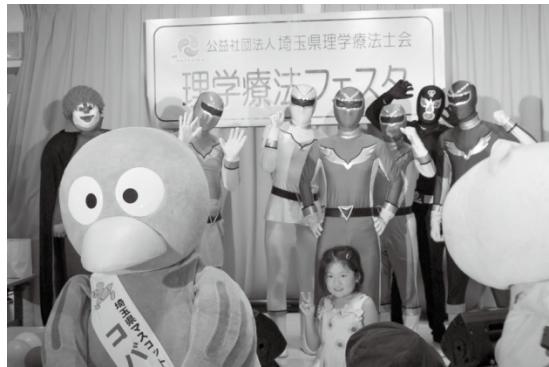
お子様と記念撮影