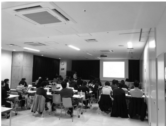
第1回研修会（三芳エリア）