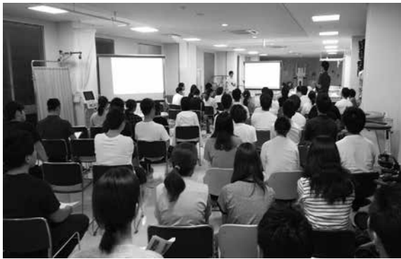
深谷・本庄エリア研修会