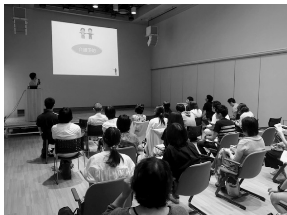
西部ブロック公開講座