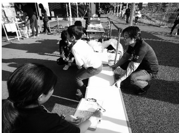
啓発活動事業風景