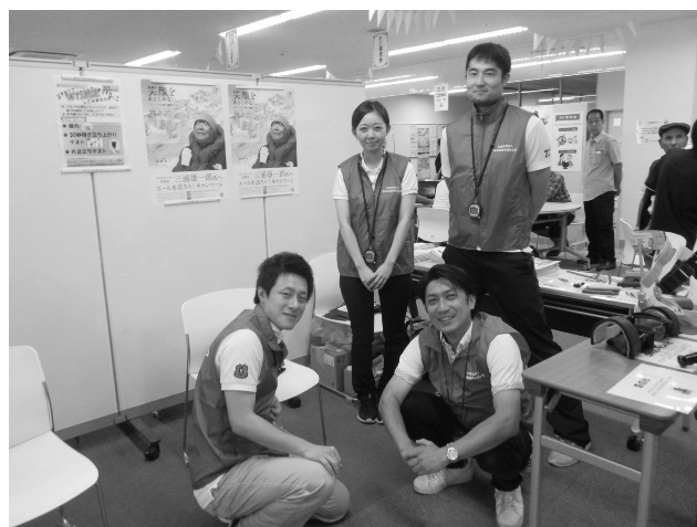
啓発活動事業風景