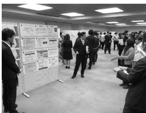
症例検討会（所沢エリア）