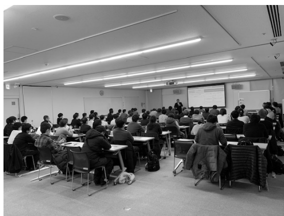
西部ブロック研修会