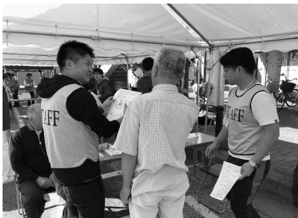
啓発活動事業風景