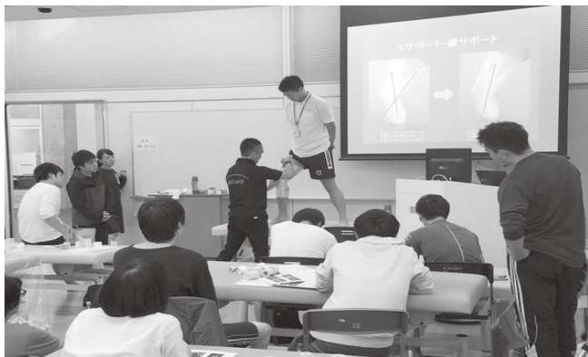
スポーツサポート活動（障がい者ふれあいピック大会）